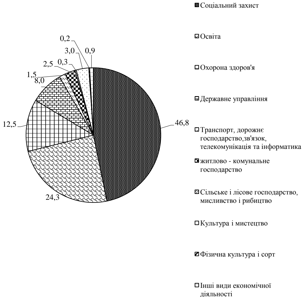
Рис. 2. Частка видатків по загальному фонду в розрізі функціональної класифікації в середньому за 2016-2020рр, %.